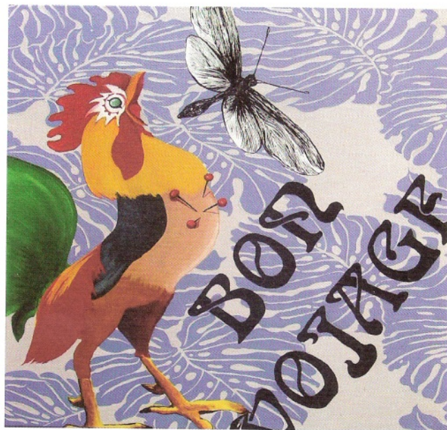
Le Poulette de Baron Samedi , olio su tela , cm 50x50, 2008