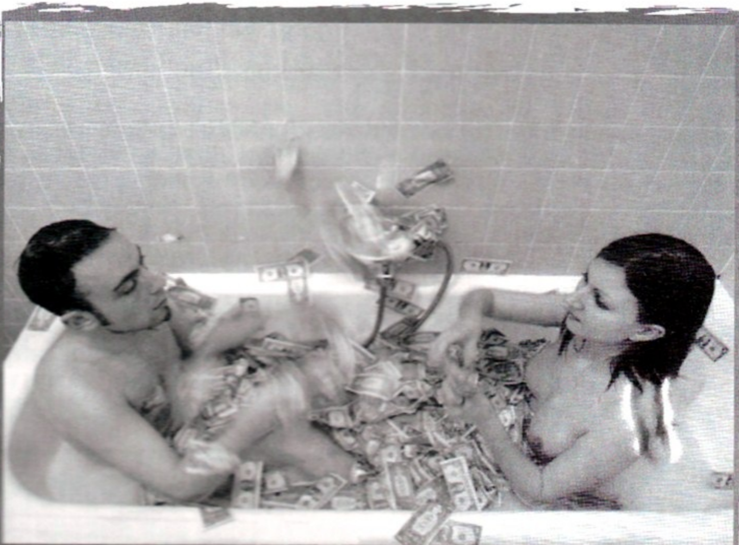
WASH YOUR SINS # $, 2005 Stampa fotografica a solvente su tela, cm 300 x 200