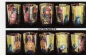
Catholique n. 5 Technique: digital photography and scotch print on glass, and mix technique

Material: wood, plastic, glass, neon Work Dimensions: length cm: 80 depth cm: 80 weight kg: 30 kg