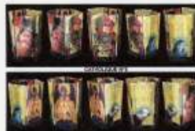
Catholique n. 5 Technique: digital photography and scotch print on glass, and mix technique

Material: wood, plastic, glass, neon Work Dimensions: length cm: 80 depth cm: 80 weight kg: 30 kg