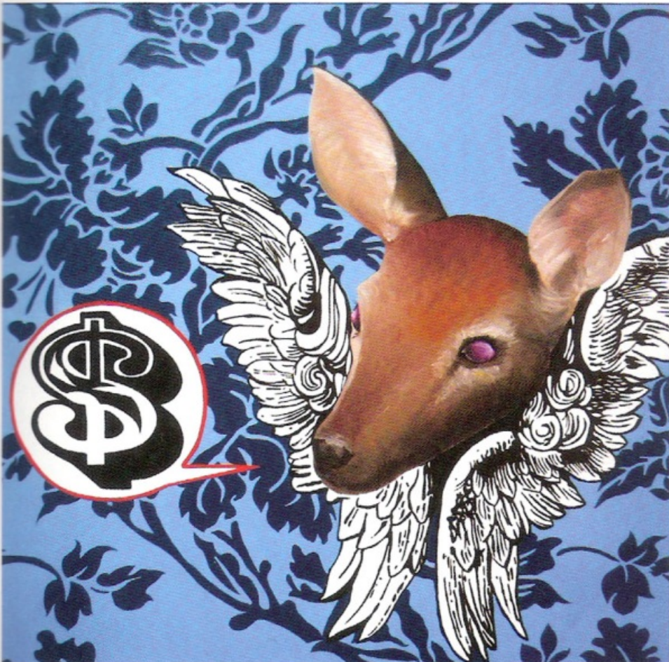
If I Was a Man Finalista Pittura, olio su tela, 100x50 cm, 2009